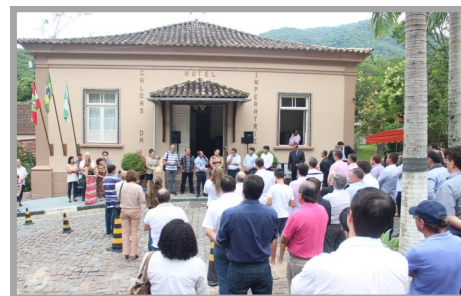
Ordem de serviço foi assinada em frente ao Hotel Caldas da Imperatriz

Em 2015, teve início uma das obras mais importantes da história da localidade. Com investimentos em torno de nove milhões de reais, todo o balneário do bairro está sendo revitalizado. A obra, custeada pelo Governo do Estado e acompanhada de perto pela Prefeitura Municipal, conta com uma série de benfeitorias ao longo dos 3,5 km de extensão. Pavimentação em "paver", drenagem, ciclovia e calçada fazem parte do "pacote de melhorias" de Caldas.